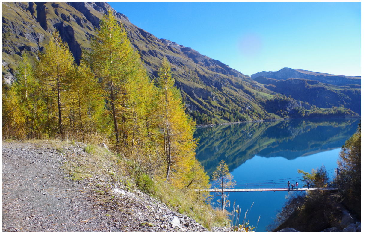
La nature et l'offre qui se construit autour de l'eau sont des points forts que peut mettre en avant Anzère.

La question des modes de financement du tourisme est en chan-