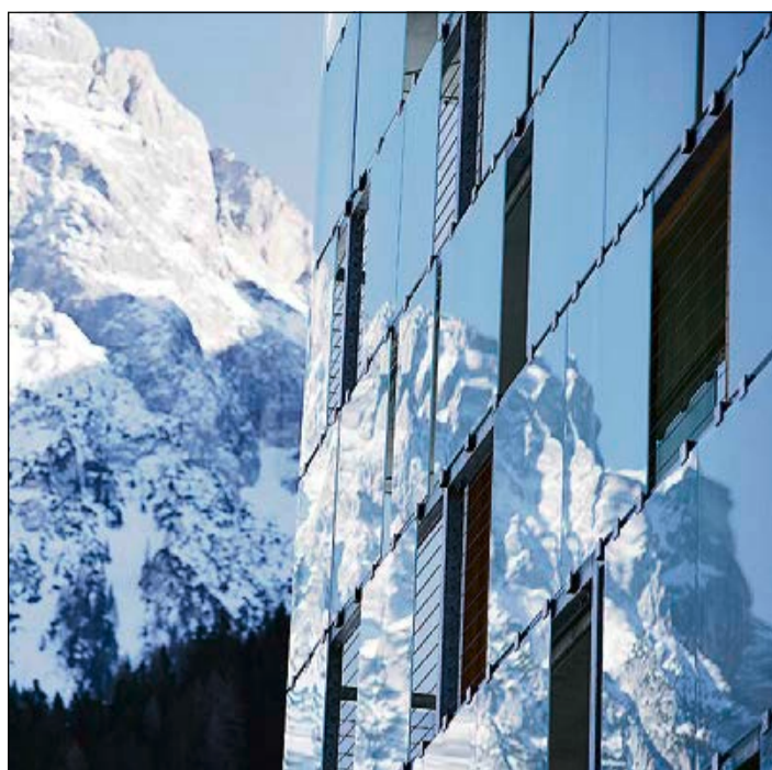
La façade en miroirs du Cube Hotel Nassfeld, en Autriche.